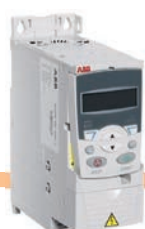
Convertidores de frecuencia