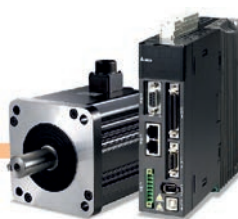
Servomotores y Servodrives