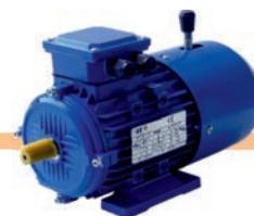
Motores con Freno