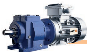
Reductores Coaxiales de Engranajes