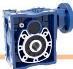
Reductores Ortogonales Hipoides