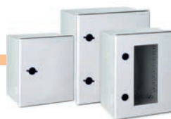
Armarios en poliéster