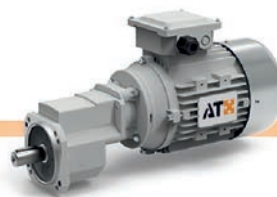
Reductores para sistemas de alimentación de ganadería (Avícola, Porcino, ...)