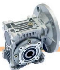
Reductores Sinfín Corona