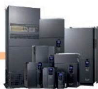
Convertidores de frecuencia