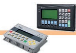
Terminales LCD Alfanuméricos