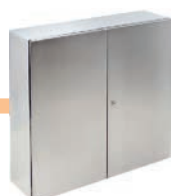
Armarios en acero inoxidable