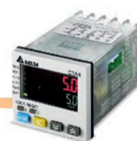
Contadores, Temporizadores y Tacómetros