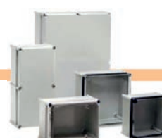
Cajas de doble aislamiento